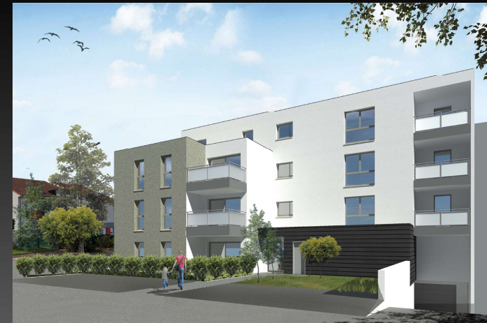
Appartement 200 - T3 - Etage 2