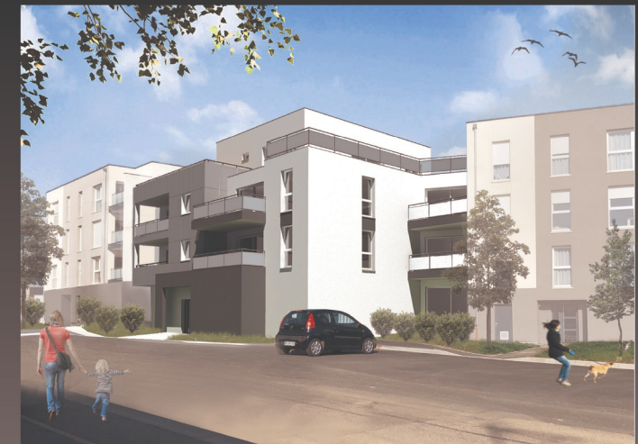
Appartement 313 - T4 - Etage 3