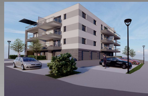
Appartement 315 - T2 - Etage 2

La société se réserve la possibilité d'apporter des modifications qui seraient dues à des impératifs d'ordre technique et/ou administratif.